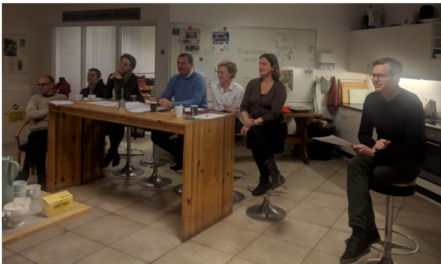
Bestyrelsen på plads under generalforsamlingen