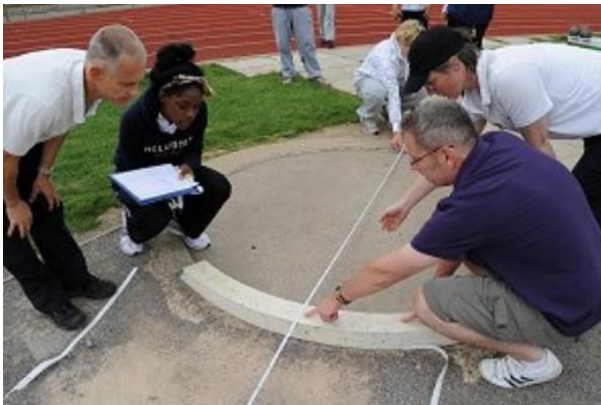
En typisk hjælpetjans i kuglestød er at stramme målebånd som kvinden i baggrunden gør her.

Overordnet set, så kan stævnerne slet ikke gennemføres uden denne frivillige hjælp fra alle sider, endnu en god grund til at hjælpe en times tid næste gang du alligevel er på stadion for at se dine børn dyste.