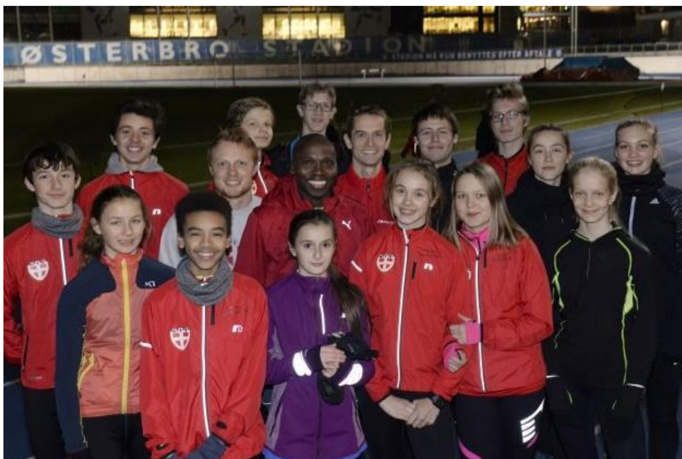
U18-holdet under et vintertræningspas.

Vi glæder os i hvert fald i trænerstaben til at se jer fyre den af til de næste stævner i august.