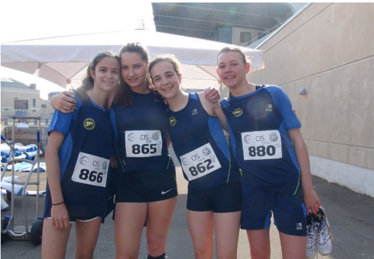
Store smil efter veloverstået hækkeløb