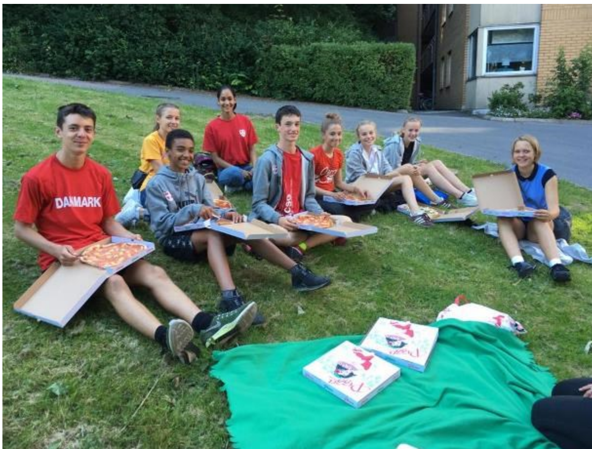
Spisepause og hygge under VU-spelen i Göteborg.

I trænerstaben ser vi frem til de sidste stævner i sæsonen, hvorefter vi laver et par sociale arrangementer for at styrke det i forvejen gode miljø.