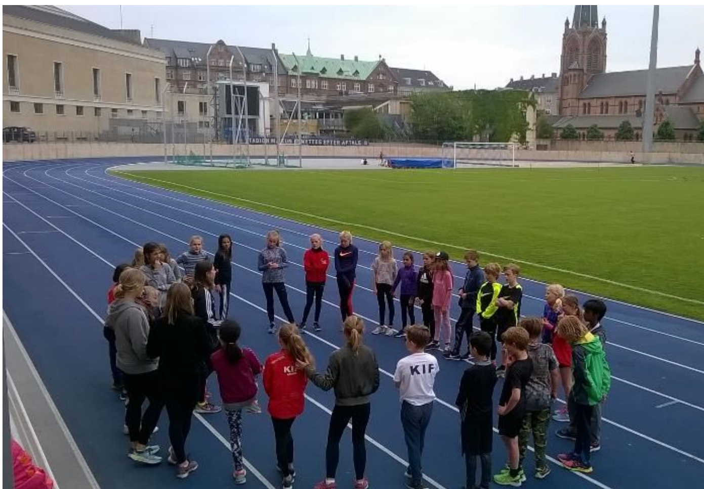
Mini-holdet ved en træning i foråret. Der er altid stort fremmøde både blandt atleter og trænere.

Så er ferien ved at være forbi, og dermed starter vi træningen op igen d 7 august. Vi vil stadig have fokus på de sidste stævner inden sæsonen er slut, og sørger for at vi for rundet denne stævne sæson godt af. Vi håber alle har haft en super ferie og har holdt træningen ved lige. Vi glæder os til at se alle minierne igen.