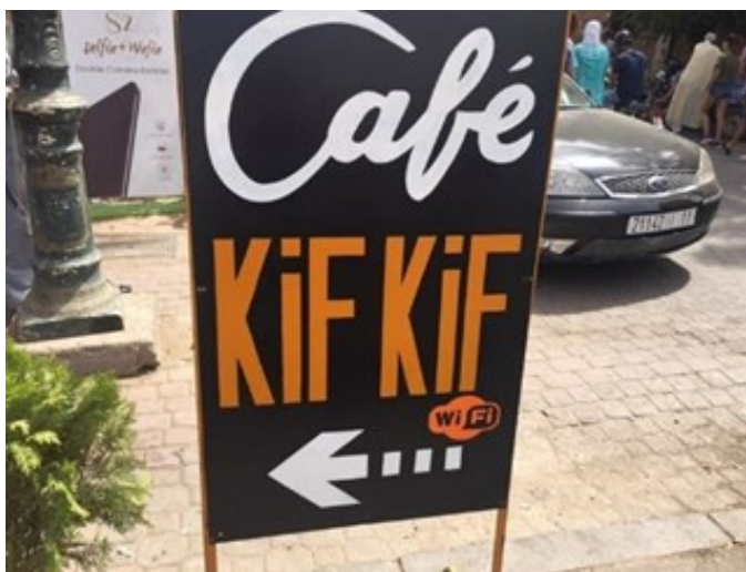
KIF's venskabs-café, spottet i Marrakech, Marokko.